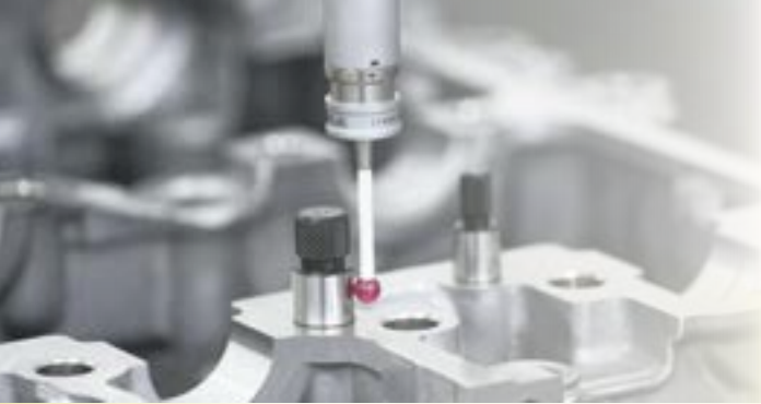
使用例 Usage example